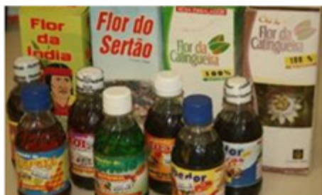
Produtos sem registro

Alguns exemplos de irregularidades encontradas.