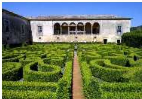
Quinta da Bacalhôa