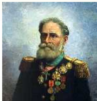
Deodoro da Fonseca