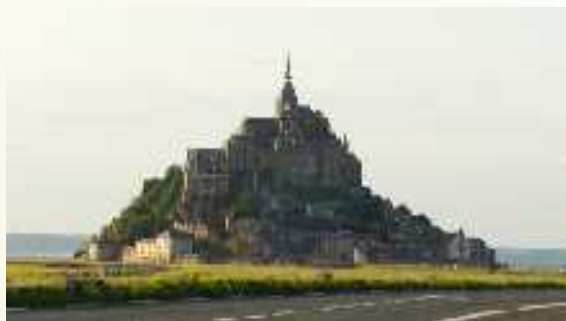
Mosteiro São Miguel.