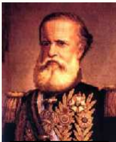
Dom Pedro II