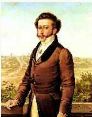
Dom Pedro I