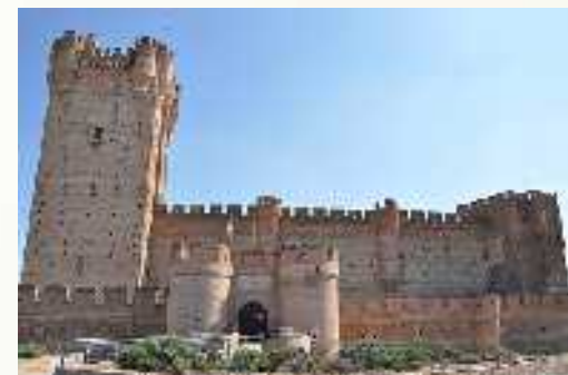
Castelo de Mota.