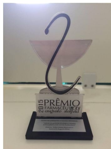
Imagens 7, 8 e 9